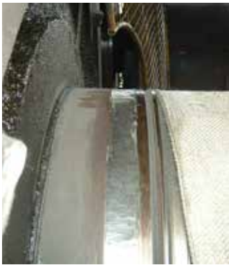
Área del sello desgastada